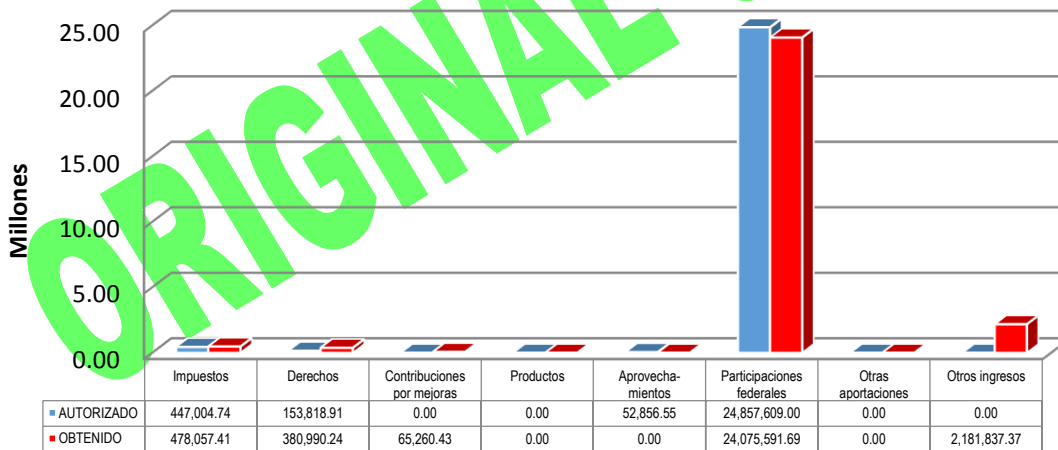
GRÁFICA 1 INGRESOS

Otros ingresos: Otros Ingresos $1,370.43, Proyecto Violencia de Género $300,000.00, CDI 14 Proyecto Ganadero $1,000,000.00, IE Emisión Bursatil Remanente $396,512.94, Otros Estímulos Fiscales $483,954.00.